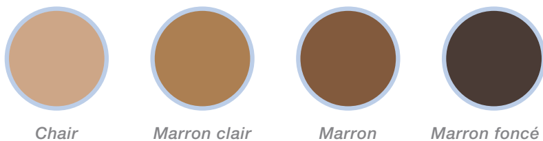
Chair Marron clair Marron Marron foncé