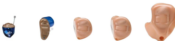
NANO SEMI-PROFOND MICRO CC INTRA-CONDUIT INTRA-CONQUE